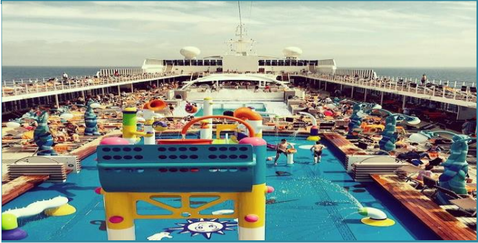
AÇIK HAVUZ VE GÜNEŞLENME ALANI