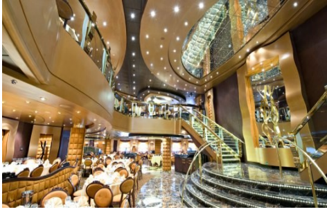
Black & White Crab Restoran