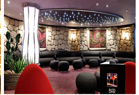
Golden Jazz Bar