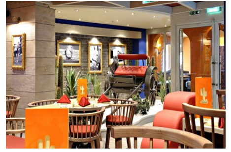
Tex Mex Restoran