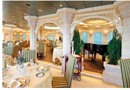
La Muse Restoran