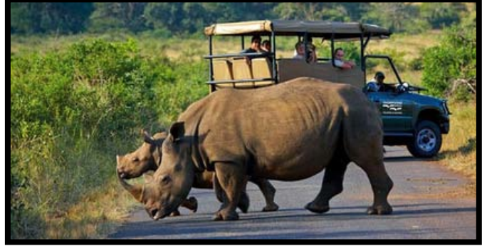
ADDO NATIONAL PARK